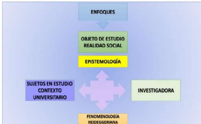
Figura 1. Enfoque Ontoepistémico.

Dentro de este marco, plantea la fenomenología Heidegger (2009), comprender lo que rodea al ser humano es una manera fundamental de ser en el mundo, las personas entienden y captan significados de los que les rodea mediante el lenguaje. En este sentido, la investigación sobre la ética del docente universitario, no se trata solamente de conocer los casos particulares, más bien se trata de establecer la esencia o significado profundo que permite elaborar una construcción conceptual general. Es así, que en este estudio la fenomenología expresa la intencionalidad de la conciencia, y que toda conciencia es conciencia de algo. Esta es la razón por la cual, desde la posición onto-epistemológica (véase Figura 1).