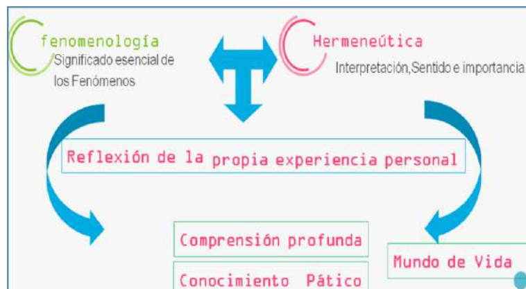
Gráfico 2. Mi camino inspirada por Van Manen (Más humano y personal).

En cuanto al paradigma, estuvo constituido por las características definidas por el Paradigma Interpretativo, el cual es holístico, hermenéutico, humanista y etnográfico, se basa en la credibilidad y transferibilidad; el enfoque de la Investigación se conecta con una indagación de corte cualitativo, con estilo de pensamiento introspectivo-vivencial, el método de Investigación fue la fenomenología hermenéutica de Van Manen el cual ofrece un modelo de investigación, basado en la noción de experiencia vivida, proporcionando una base para que los investigadores educativos puedan reflexionar sobre su propia experiencia. A continuación, se grafica lo explicado: