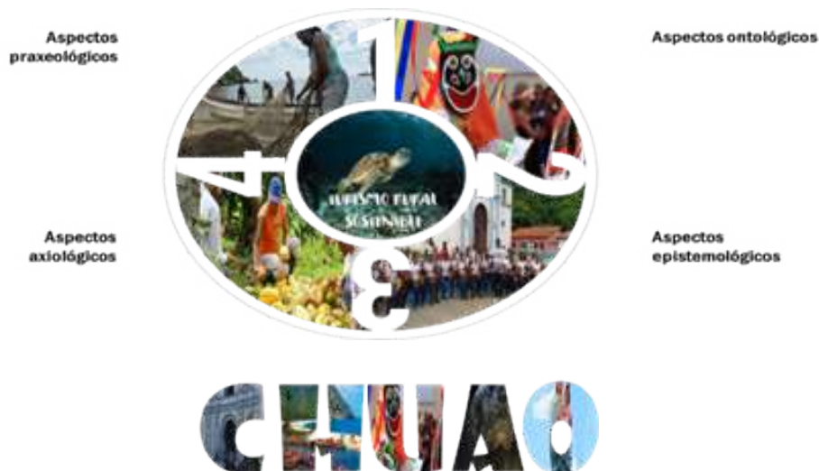
Figura 1. Episteme del Turismo Rural en el Imaginario de la Educación Ambiental.