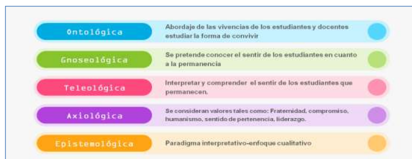
Gráfico 1. Matriz epistémico filosófica.