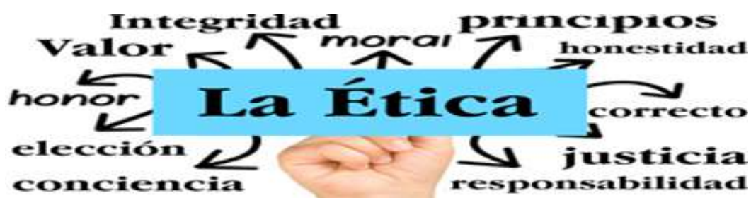
Figura II. Elementos básicos para un Acompañamiento ético.

básicos que se deben tener en cuenta para el acompañamiento ético.